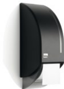
Toilettenpapierspender, 180287 2-Lagig Systemrolle, 131802