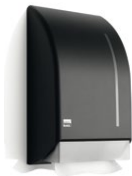
Handtuchspender, 180285 1-Lagig Papierhandtücher, 150803 2-Lagig Papierhandtücher, 160803