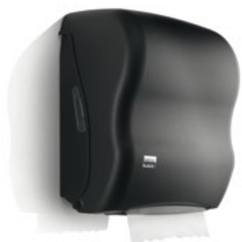
Handtuchrollenspender, 180841 Handtuchrolle, 175800