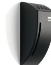
Lufterfrischer Spender, 180291 Lufterfrischer sortiert (3x2), 180316