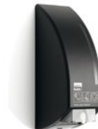
Toilettensitzreiniger Spender, 180290 Toilettensitzreiniger, 180270