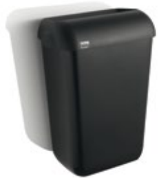
Abfallbehälter 43 Liter, 180260 auch in 23 Liter, 180268