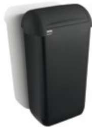
Damenhygienebox, 180269 Hygienebeutelspender, 180039 Hygienebeutel, 180035