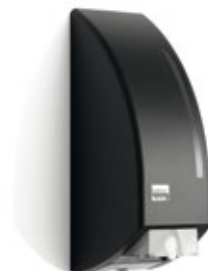
Seifenspender, 180289 Schaumseife, 180300 Alkohol Gel, 180883